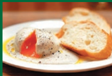
トリュフ仕立てのウフマヨ 380円