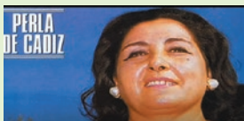
LA PERLA DE CADIZ BULERIAS DUERMETE CURRO