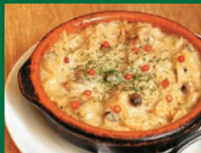
若鶏ときのこのブルーチーズソテー 800円