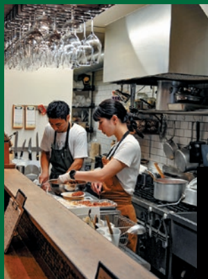
お二人がカウンターの中に居ても、どの客席からも声がかけやすい。