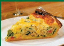
社職と ほうれん草 のキッシュ 680円