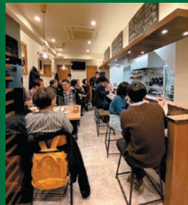
地元の人が気軽に立ち寄るバル。ゆったりとした雰囲気でお話はずむ。