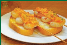
エビのプロチエッタ 650円