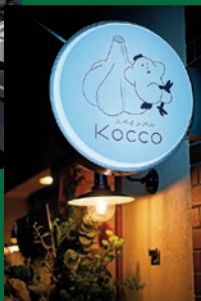
かわいいにわたりのロゴにほっこり。