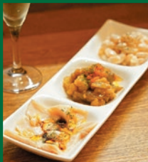
前菜3種 盛り合わせ 800円