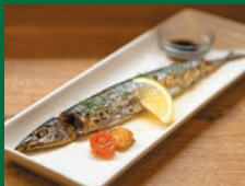
骨まで食べられる秋刀魚のオープン 焼き価格未定