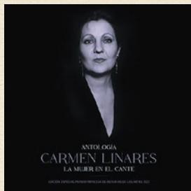
“Antología de la Mujer En El Cante”(23) Carmen Linares