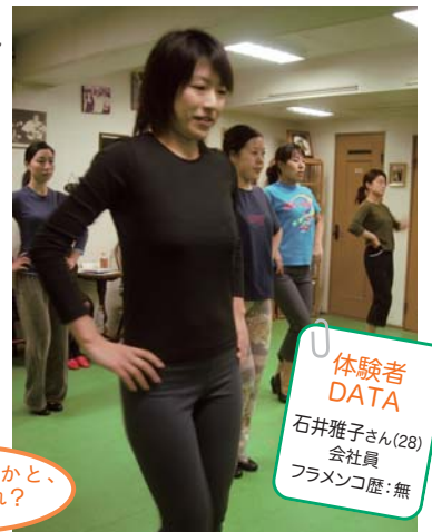
つま先、かかと、つま先…あれ？