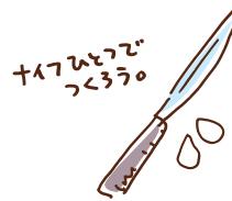
たまごはつぶして よく混ぜる。