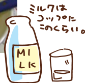
ミルクはコップの1/5のくらいい。