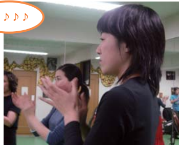
バルマ（手拍子）の練習。見よう見まねで…