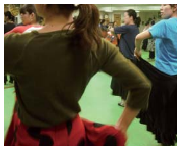
タンゴの振りつけ。スカートに粋につかって…